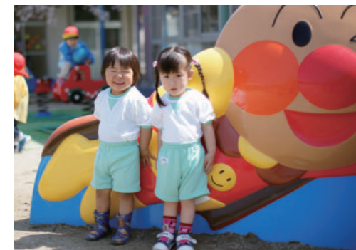
3歳児クラスより体操服が制服になるので、毎日の準備が軽減されます