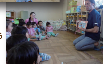
外国人による英語指導